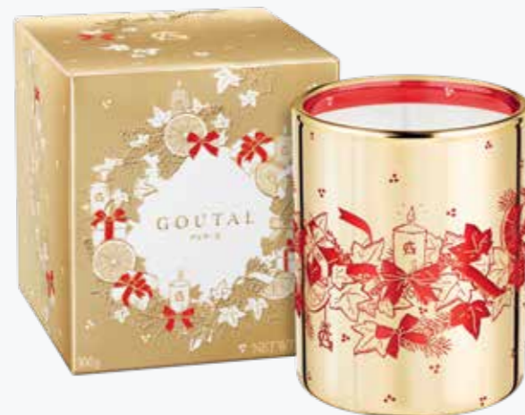
NOEL KERZE VON ANNICK GOUTAL

IMPRESSUM: Das Kundenmagazin der Ritter Parfümerie, Vordergasse 65, 8200 Schaffhausen. Herausgeber: Chili Digital AG, Kreuzstrasse 5, 8400 Winterthur, Telefon 044 315 90 00, www.chili.ch. Chefredaktion: Meike Tarabori, meike.tarabori@chili.ch. Redaktionelle Mitarbeit: Mirjam Eschbach, Gabi Farner, Nathalie Grolimund. Druck: Unionsdruckerei AG, 8200 Schaffhausen. Anzeigenverkauf: Chili Digital AG, Caroline Meili, Telefon 043 500 28 73, caroline.meili@chili.ch. Auflage: 13'000, davon 12'400 persönlich adressiert verschickt. ISBN-Nr.: 978-3-905989-98-4. Dieses Magazin ist auf FSC-Papier gedruckt. Copyright: ©Chili Digital AG, 8400 Winterthur. Nachdruck und elektronische Wiedergabe nur mit schriftlicher Genehmigung des Verlags.