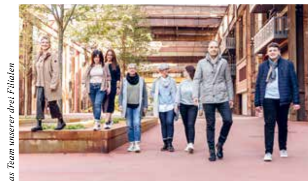
Das Team unserer drei Filialen