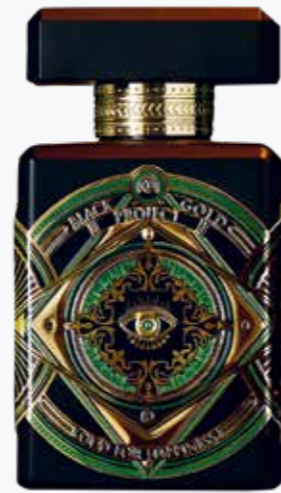
OUD FOR HAPPINESS VON INITIO