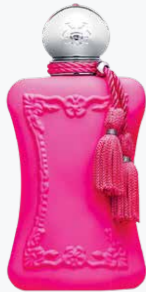
ORIANA VON PARFUM DE MARLY